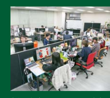
自分が仕事をしやすいものを自由に買ってよい。だから社内の机や椅子はバラバラ。机周りにフィギュアを飾っている人も多い。