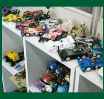
ミニ四駆の部活動があり、年に2回は社内大会も。社内の間にはみんなが改造した車体が並び、マイ車体を自慢するためのアプリも作ってしまった。